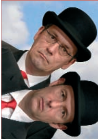
Kabarett Alma Hoppe